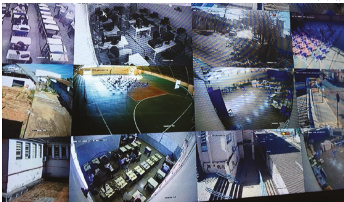
Medida do Estado objetiva enfrentar violência no ambiente escolar e promover cultura de paz nas instituições

Os testes são realizados há pouco mais de um mês e, neste período, a equipe descobriu