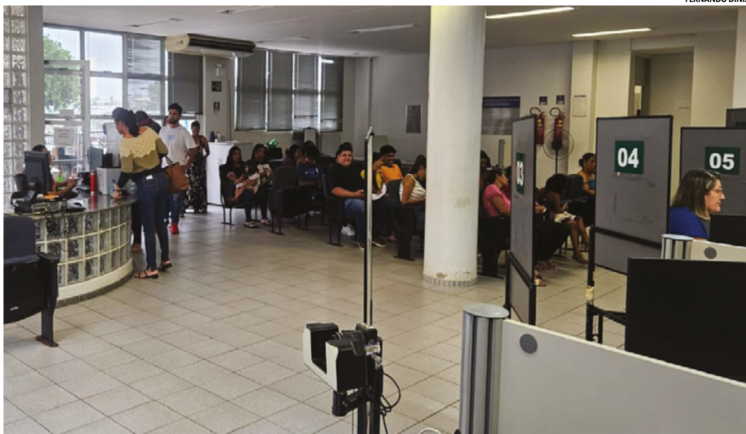
Movimento no Cartório Eleitoral, no bairro Maracanãzinho, deve aumentar nos próximos dias, até o fechamento do prazo de inscrição em 8 de maio