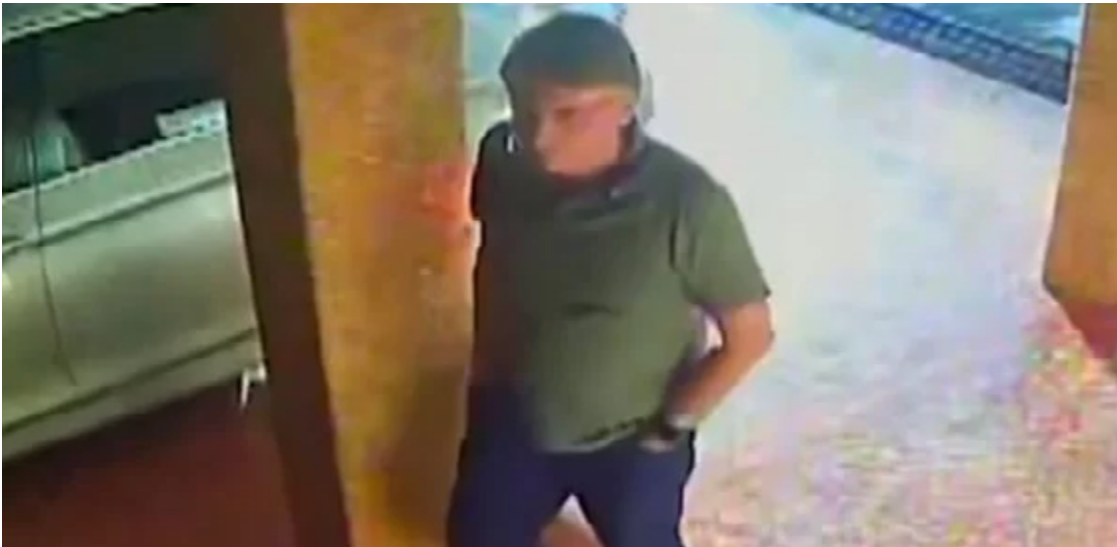
Jair Bolsonaro: refúgio por dois dias na embaixada da Hungria, em Brasília

O Ministério das Relações Exteriores convocou para explicações o embaixador da Hungria, Miklós Halmi, em um sinal de contrariedade do governo brasileiro com a situação. O gesto de hospedar Bolsonaro, segundo auxiliares do Executivo, tem sido lido como uma in-