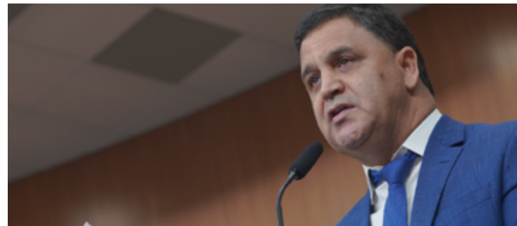
Wilde Cambão: prazo para emendas parlamentares