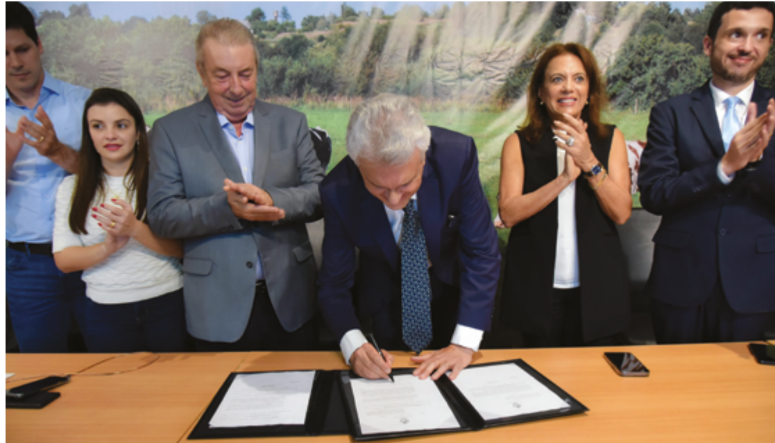
Ronaldo Caiado, entre Schreiner e Gracinha, “não podemos ter lei que incentiva indústria e sufoca produtor”

Fruto de estudos desenvolvidos pelas secretarias da Agricultura, Pecuária e Abastecimento (Seapa) e Economia, o pacote inclui alteração e regulamentação das leis nº 13.591/2000, que institui o Programa Produzir, e nº 20.787/2020, que trata do Programa do Pró-Goiás, no sen-