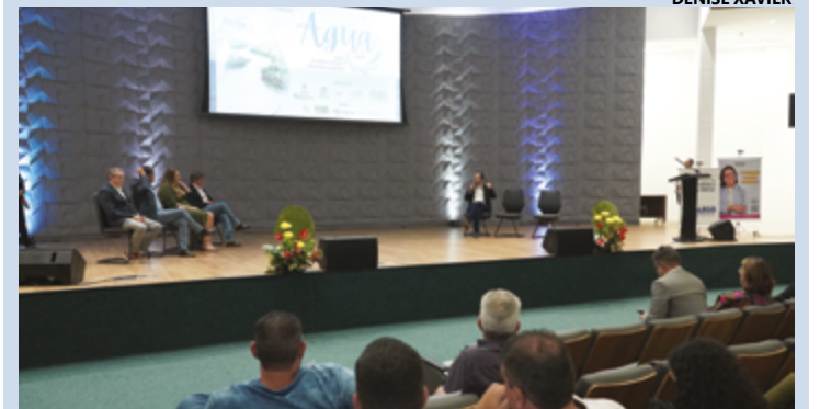
Sessão solene realizada na Alego no último dia 22 de março tratou, entre outros temas, do combate à prática que comprometa os recursos hídricos

NUTRIÇÃO PHARMACEUTICA PREVENLAB LTDA, CNPJ 41.219.112/0001-15, Torna público que RECEBEU da SEMMA/Anápolis, licença ambiental de instalação, da atividade 10.99-6-99 - Fabricação de outros produtos alimentícios não especificados anteriormente, sito a Rua Israel Pinheiro (ADJACENTE A RODOVIA BR 060 - SAÍDA APS-BSB) CEP: 75.103.850.