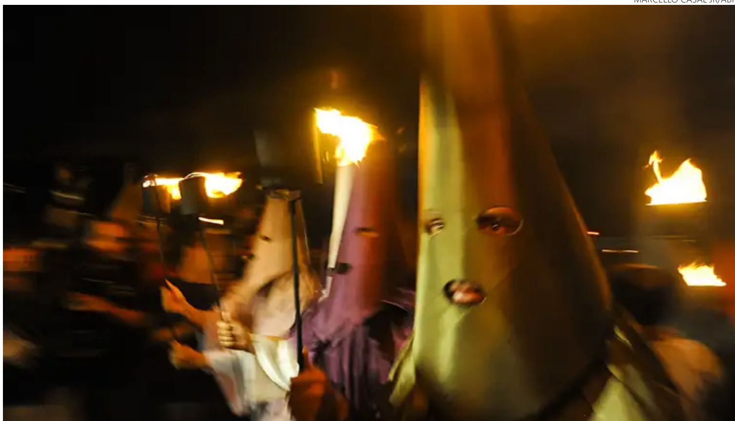
Representação sobreviveu aos séculos graças a cuidados e preocupação dos vilaboenses com a própria história

“A estética do presente, na prática de capitalização do tempo, é estabelecida a partir dos horários para a realização do evento, de modo que seja adequada aos potenciais turistas. E o futuro é a articulação com as escolas e a participação dos estudantes no evento,